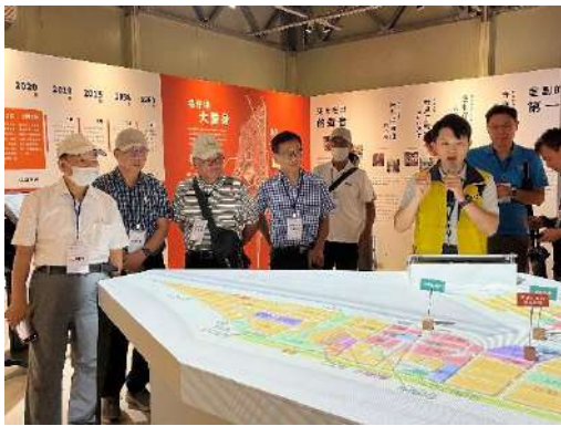
▲「新泰塭仔圳市地重劃案」導覽