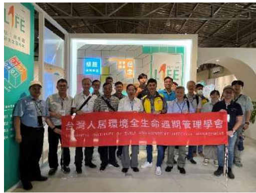
▲於塭仔圳故事館門口合照