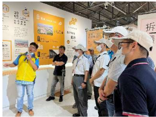
▲「新泰塭仔圳市地重劃案」導覽