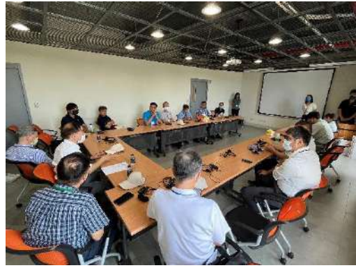
▲「五股垃圾山環境整頓計畫」簡報