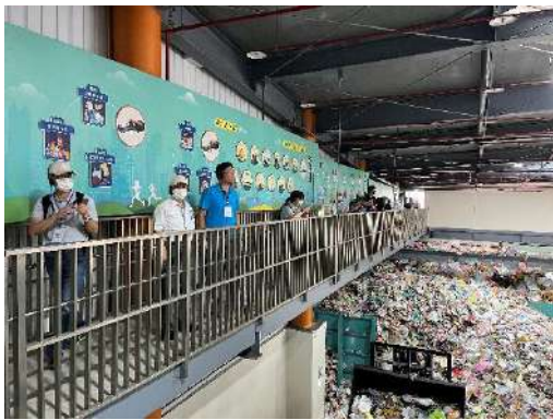
▲參觀人工智慧資源回收物細分選廠房